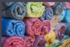
Tekstil dan Garmen