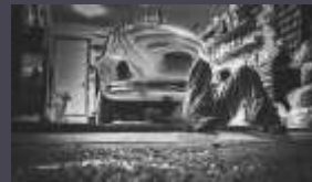
Produksi dan Distribusi Otomotif