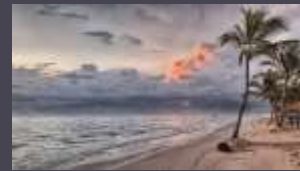
Real Estate dan Wisata