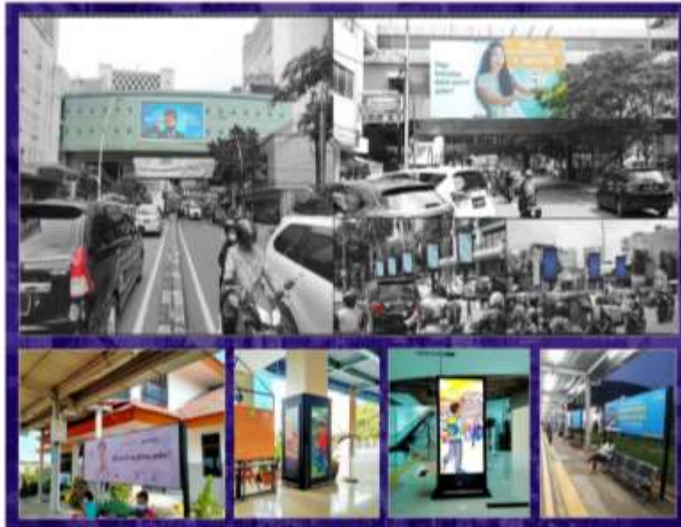
Gambar 2. Aset Digital OOH dan DOOH Perseroan