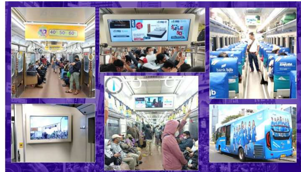
Gambar 3. Contoh Layanan Transit Media Perseroan