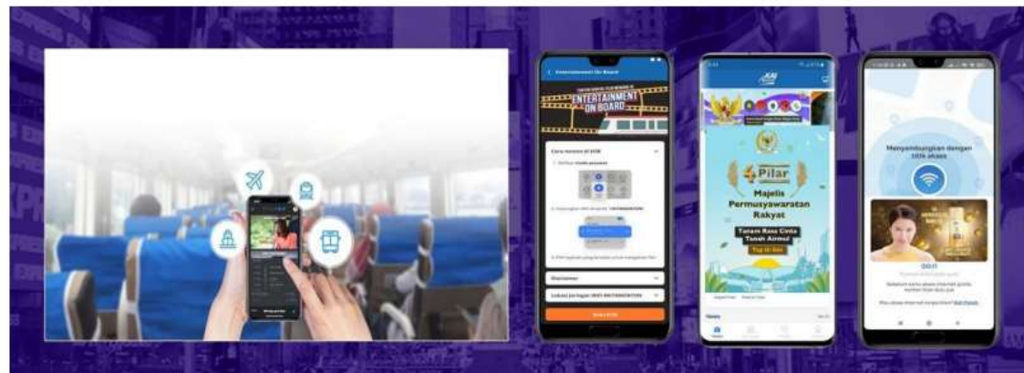
Gambar 4. Layanan Digital Advertising Perseroan