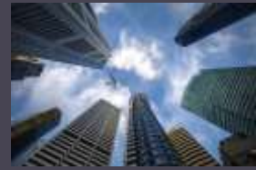
Konstruksi dan rental gedung kantor