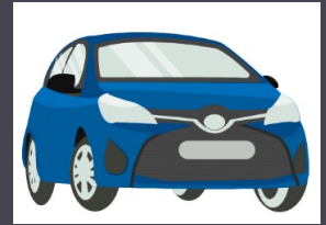
Suku Cadang Kendaraan