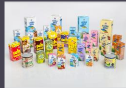
Makanan & Minuman