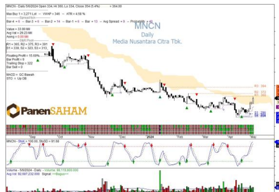
Technical Analysis by Lathif Arafat, CTA

Ada potensi reversal balik arah dari downtrend menjadi uptrend jika harga saham MNCN mampu breakout level 360-364 jika diiringi volume cukup signifikan dengan target price 372-394. Batasi resiko jika terjadi pelemahan harga saham dibawah <350.