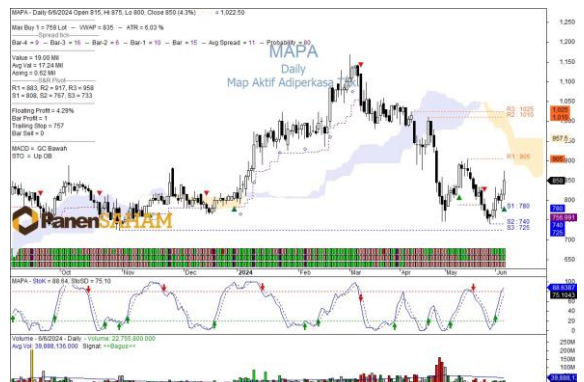
Technical Analysis by Lathif Arafat, CTA

Saham MAPA terindikasi balik arah menjadi uptrend karena memiliki dua level bottom price yang sama di harga 740. Pola reversal double pattern ini sukses terbentuk jika berhasil menembus area harga konfirmasi di level 900-905 dengan target kenaikan harga sampai dengan 1.010-1025.