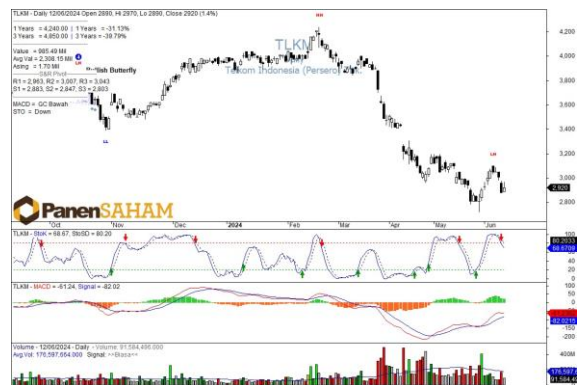
Technical Analysis by Lathif Arafat, CTA

TLKM masih bergerak downtrend,tapi ada potensi balik arah (reversal) karena terindikasi membentuk pola Bullish Inverted Head and Shoulder Pattern dengan area konfirmasi necklinenya di area 3.100-3140, jika pola pattern ini sukses terbentuk maka minimum target price di level area harga 3.400-3.440.